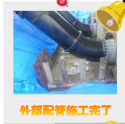
外部配管施工完了