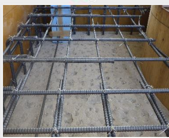
組みあがりました