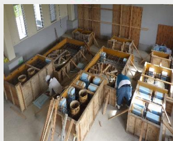
鉄筋組んでいます