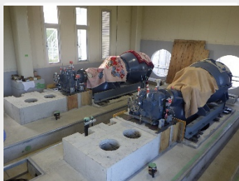
大きなポンプは2台