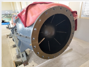
ポンプ吐き出し部