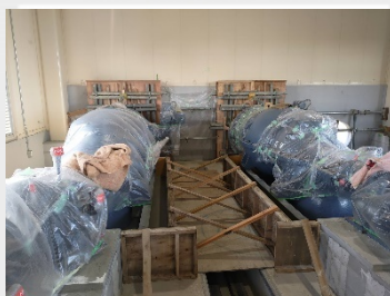
このポンプに繋がります