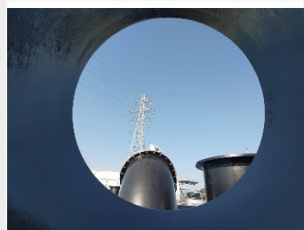
建屋から覗いてみた