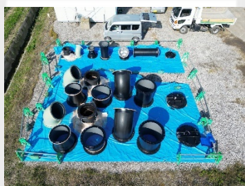
巨大な配管材たち