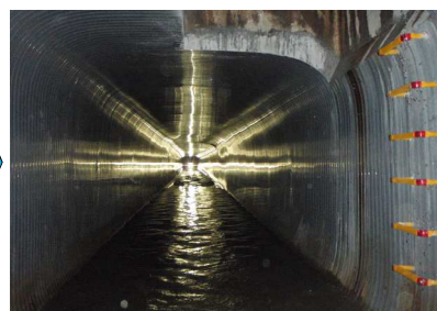
施工完了：製管完了(下水道施設内)