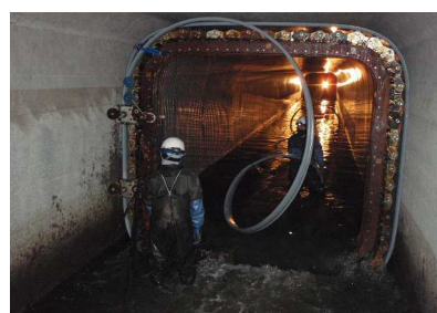
施工状況：製管状況(下水道施設内)