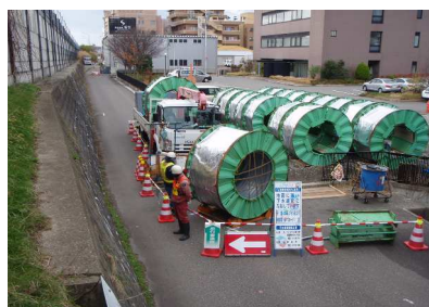
施工状況：製管状況(陸上)