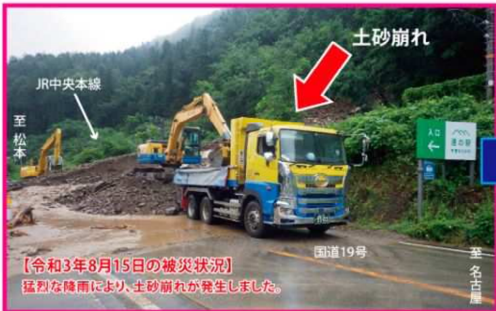
【令和3年8月15日の被災状況】 猛烈な降雨により、土砂崩れが発生しました。

令和3年度 木曾維持管内北部地区災害復旧工事 工期：令和4年4月1日～令和5年2月28日