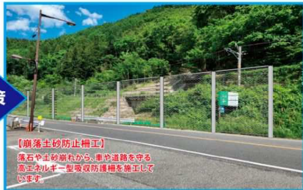
【崩落土砂防止柵工】 落石や土砂崩れから、車や道路を守る 高エネルギー型吸収防護柵を施工して います。